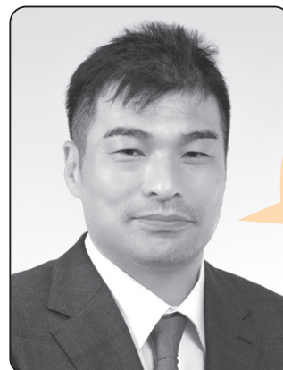
佐野 和也 議員