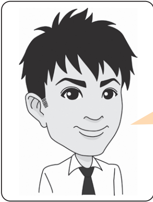
中野 健太郎 議員