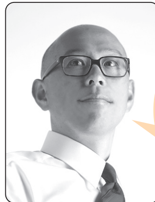
辻村 岳瑠 議員