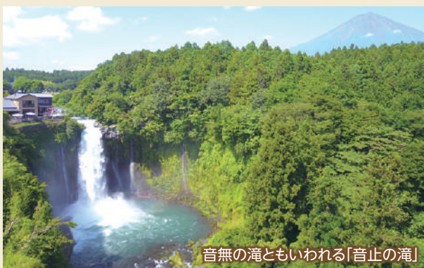
音無の滝ともいわれる「音止の滝」