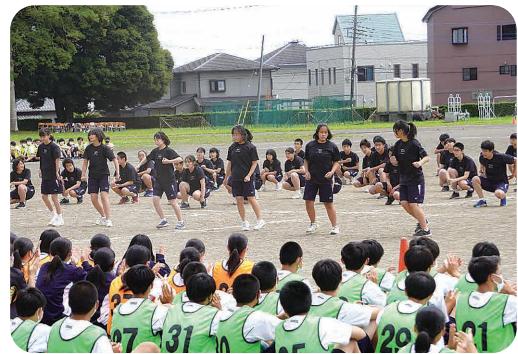
▲富士宮北高北嶺祭体育の部での 集団演技披露

また、市役所清掃や大月線の花壇の花植え等、地域の一員として主体的に社会で生きる人を目指し、楽しい学校生活を送っています。