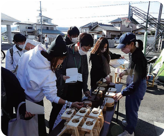
▲宮分マーケットでの作業製品販売

富士山の山肌のゴツゴツしたところを丁寧に描きました。富士山には、いろいろな顔があり私たちの宝物です。