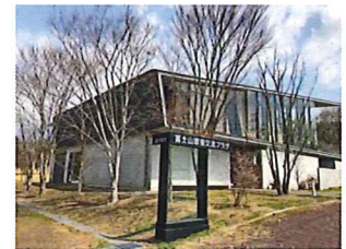
富士山環境交流プラザ