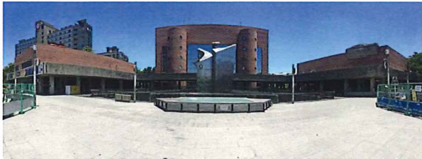
台南市永華文化中心

現代天目茶碗と陶芸逸品、遠方にいる家族や友人に故郷の写真に一言添えた「一筆写信」