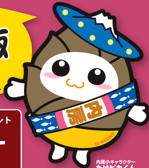
内房小キャラクター たけピカくん