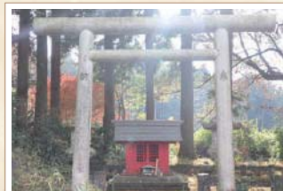
5 工藤祐経の墓 工藤祐経が曾我兄弟に討たれた場所といわれる