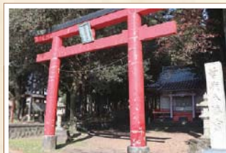
9 曾我八幡宮 建久8(1197)年、源頼朝が畠山重忠に命じて曾我兄弟を祀らせたといわれる