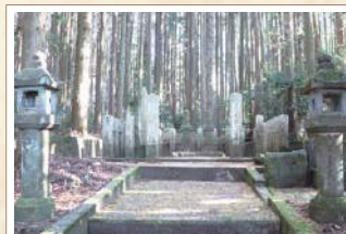
10 曾我兄弟の霊地 曾我兄弟の兄(曾我十郎祐成)が、仁田四郎忠常に討たれた場所といわれる