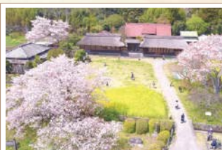
7 井出家高麗門・長屋 この周辺に源頼朝の宿舎「富士野神野御旅館」があったといわれる