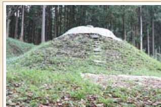
6 上井出天神社 相撲の名手だった曾我兄弟の父(河津祐泰)の供養のため、奉納相撲が始まったともいわれる