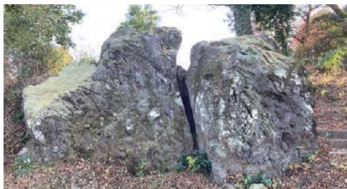
3 曾我の隠れ岩 曾我兄弟が身を潜め、工藤祐経の討ち入りの相談をしたといわれる