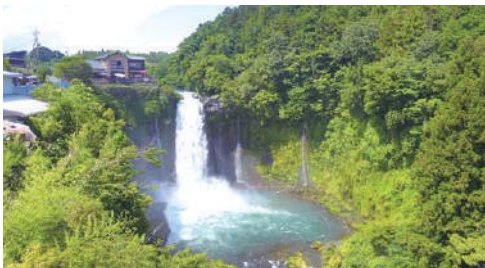
4 音止の滝 落差が約25mの滝で、音無の滝ともいわれる