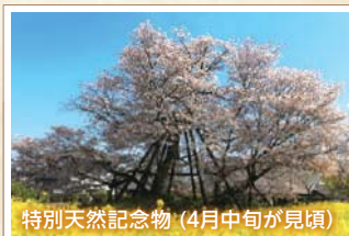
8 狩宿の下馬ザクラ 源頼朝が馬から下り、この桜に馬をつないだことから「駒止めの桜」ともいわれる