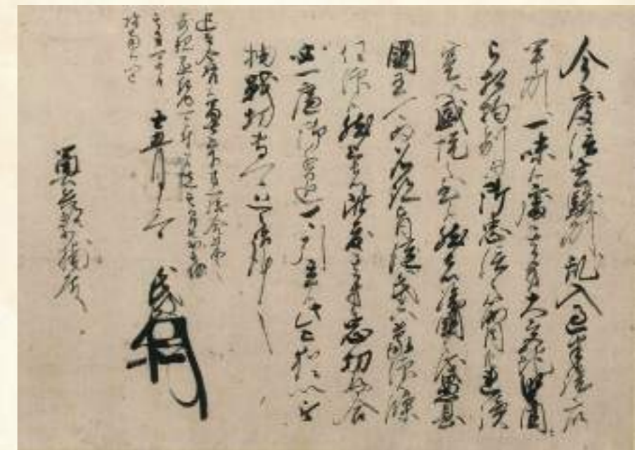
▲北条氏政書状(1569年5月3日/静岡県立中央図書館蔵)