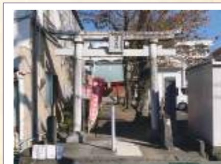
神田蔵屋敷稲荷神社