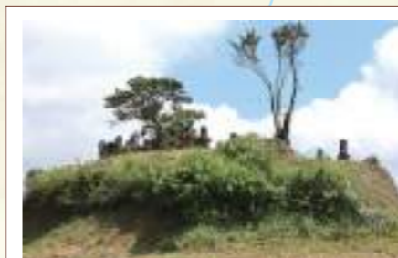
大鏡坊墓所 村山集落を管理した村山三坊(宿坊)の一つ大鏡坊は、主に村山修験の祖・末代上人を祀る大棟梁権現社を管理した。