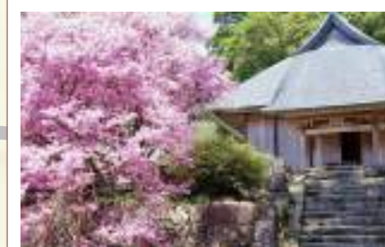
富士山興法寺(村山浅間神社・大日堂) 世界遺産富士山構成資産の一つ。数百年の間、富士山信仰の重要な拠点として、多くの修験者や登山者が訪れた。