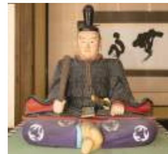
▲今川義元像(臨濟寺蔵)