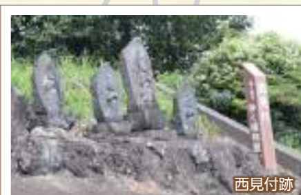
西見付跡・東見付跡 富士山修験の拠点として栄えた村山には、江戸時代、伊豆国・伊勢国・美濃国・尾張国などから多くの登山者が訪れた。駿河国の今川氏は、富士山中で修業を積む村山の山伏の行動力と情報力を頼りに、情報収集したとされる。集落の東西に見付を設け、不審者の出入りを取り締まった。