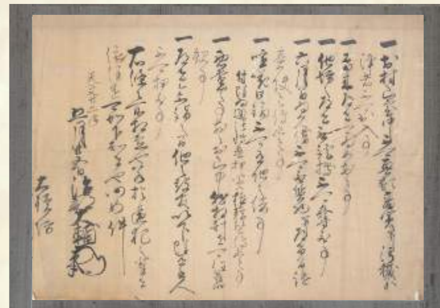
▲今川義元判物(1553年・東京大学資料編纂所撮影/村山浅間神社蔵)