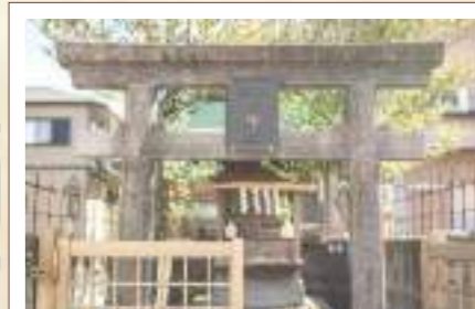
神田市神社 近くの浅間大社の門前では「富士大宮楽市」が開かれた。「市神さん」と呼ばれる商売の神が祀られ、大正11年に祠が造られた。