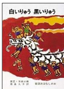
白いりゅう 黒いりゅう 賈芝、孫剣冰編 君島久子訳/岩波書店

絵本や本は、子どもが育っていく上でなくてはならない大切なものです。絵本の読み聞かせは、学校でも盛んに行われるようになりましたが、その先にある児童書となると、数多く出版されている本の中からどんな本を子どもたちにすすめたらよいのか、大人としても迷うところです。