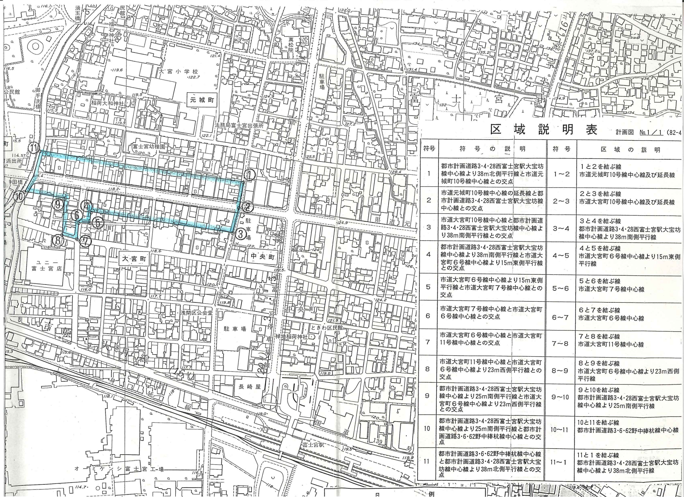
区域説明表 計画図 No.1 / 1 (82-4)